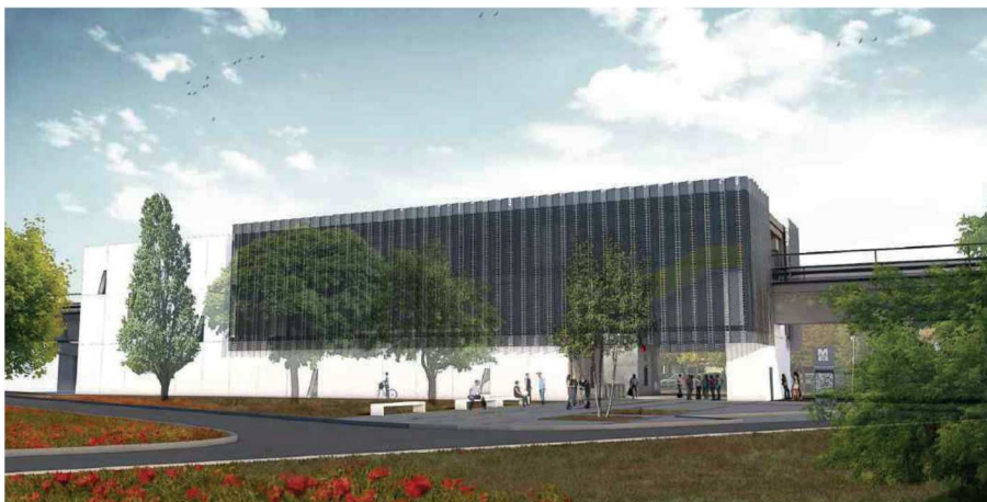
Illustration de la station Parc Technologique du Canal Source : Cabinet d'architecture Séquence

La station Parc Technologique du Canal , située sur l'avenue de l'Europe, cette station desservira le cœur de la zone d'activités